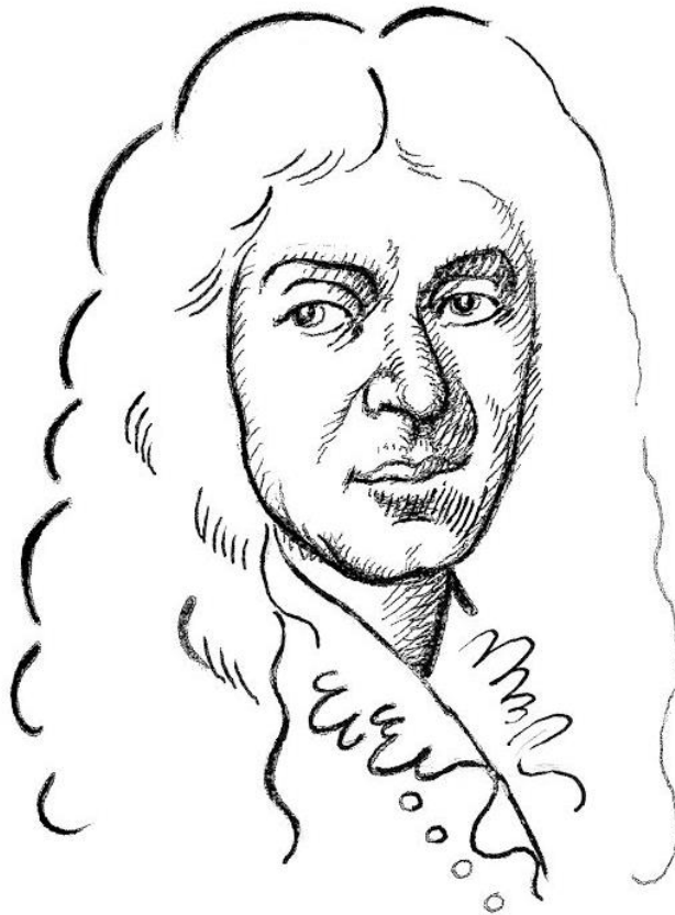
Jean-Baptiste Lully. Kresba Lenky Kerelové (2017).

Po slavnostní francouzské předehře vystupují v prologu alegorické postavy Slávy a Moudrosti se svým doprovodem. Opěvují vládce universa, kterému se zlíbilo uspořádat pro obě postavy divadelní hru jakožto ušlechtilý zápas o jeho přízeň. V Lullyho době byl vládcem universa míněn Ludvík XIV.: o jeho přízeň se Sláva a Moudrost ucházejí.